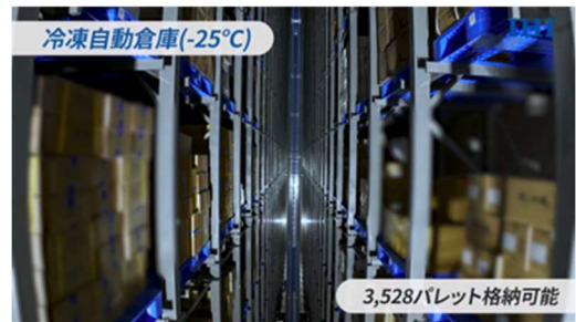
冷凍自動倉庫の庫内

これからも最新の設備と安心・安全なアンマーブランドで、県内外のお客様に製品を提供し続け、さらなる成長と発展に期待したいと思います。