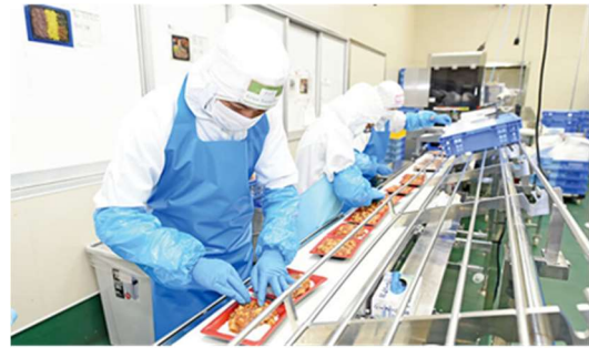
糸満工場の総菜ライン

パック、島豆腐などの食材から氷まで、アンマーブランドで製品を生産しています。糸満工場の総菜弁当ラインでは、毎日10種類以上の弁当を製造し、1日あたり約1万パックが出荷されています。