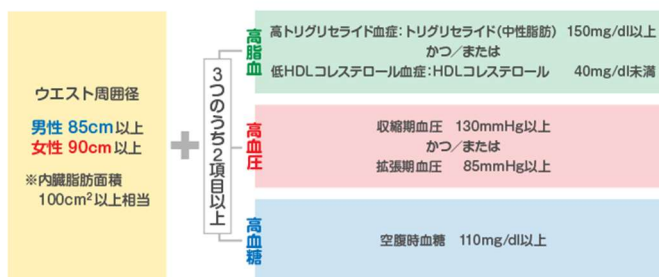
厚生労働省 e-ヘルスネット [情報提供] より

健診の結果、腹囲（男性 85 cm 女性 90 cm）と体重、血圧(130/85 以上)、脂質（中性脂肪 150mg/dl、HDL コレステロール 40mg 以下）、血糖（空腹時血糖 100mg 以上 HbA1c5.6%）の項目がメタボリックシンドローム診断の基準とされます。