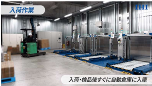
自動倉庫の受入れ口

また、当社の冷凍・物流倉庫には、最新の自動倉庫が導入され、パレットと格納棚の位置をバーコードで管理し、商品の受け入れから出荷