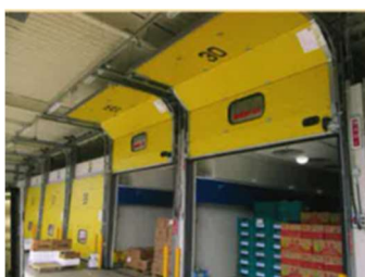
バナナ熟成加工室

また、組合としては2002年には品質マネジメントの国際規格 ISO9001 の認証取得。