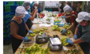
バナナ袋詰め作業

特に、2016年にはバナナ熟成加工室を整備し、最新のコンピュータ技術を備えた差圧式システムにより最適なバナナの熟成加工を実現しています。なお、同施設はバナナ以外にキウイやアボカドにも利用されています。