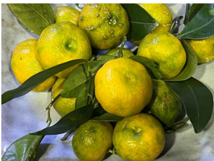
今が旬の熟したシークワサー